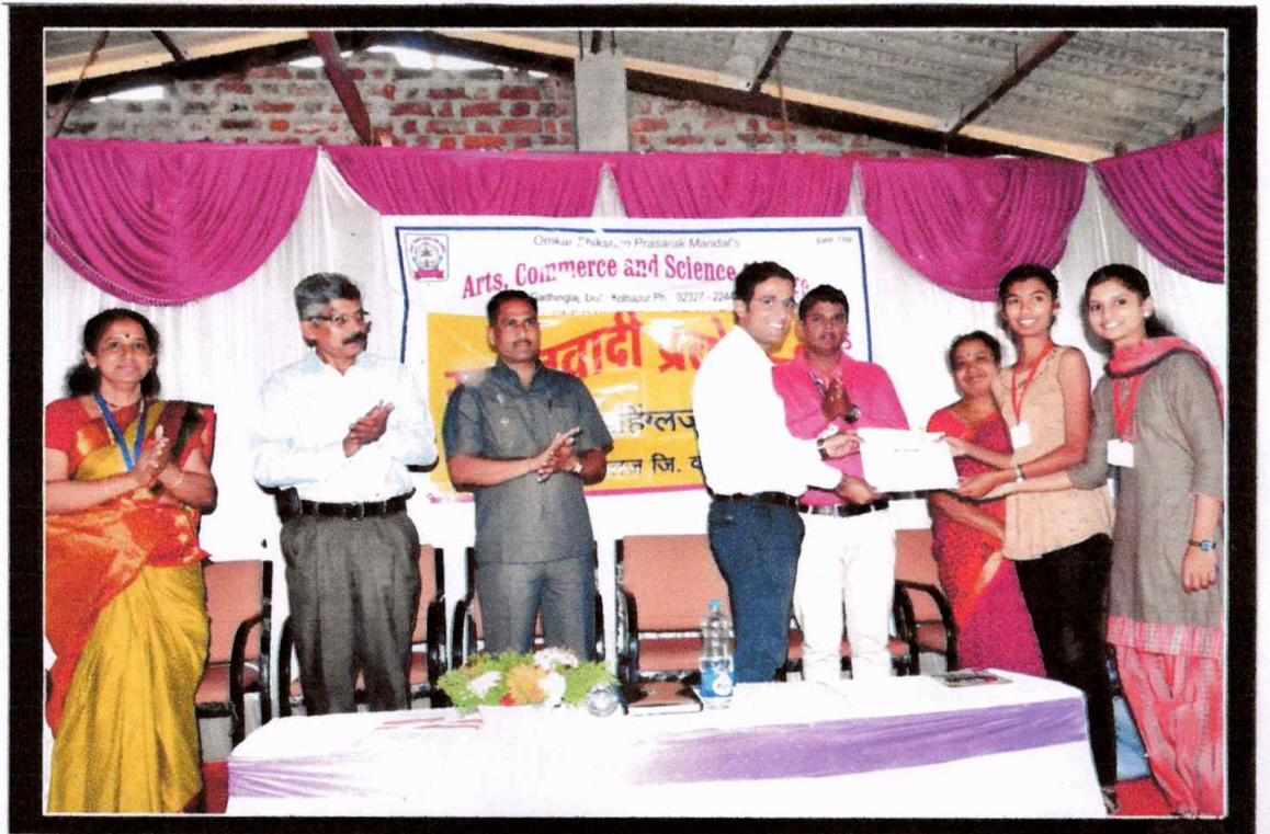
प्रमाणपत्र वि०२०१७ कवताना महेश्वर