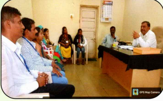
वाणिज्य विभाग अभ्यास भेट