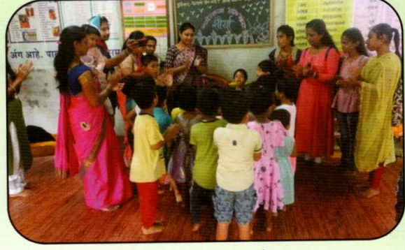
अंगणवाडी अभ्यास भेट