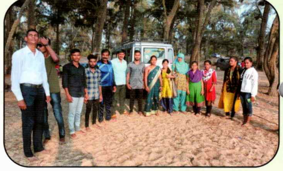
वाणिज्य विभाग अभ्यास सहल