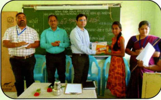
वाचन प्रेरणा दिन