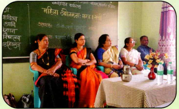
महिला उद्योजकता कार्यक्रम