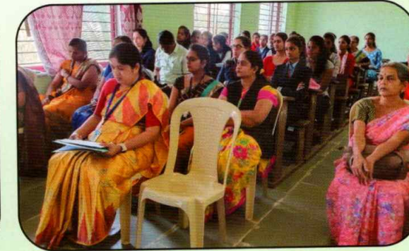
कार्यशाळेत सहभागी प्राध्यापक व विद्यार्थी