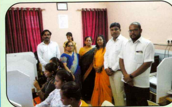
लॅंग्वेज लॅबला भेट