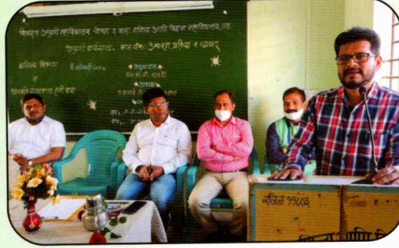
अग्रणी कार्यशाळा उद्घाटन