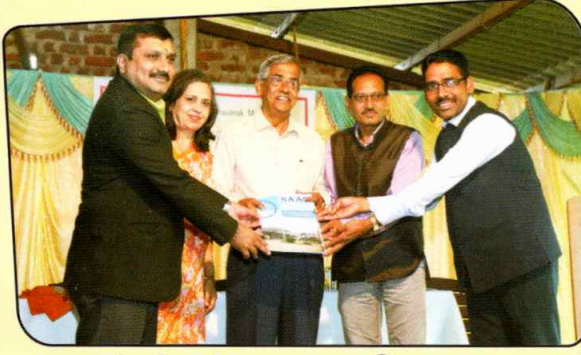
नेक पीअर टीमकडून अहवाल स्विकारताना