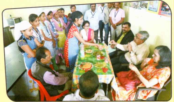
गृहशास्त्र विभागाला भेट देताना पीअर टीम व संस्था प्रतिनिधी