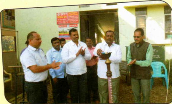
क्रीडा महोत्सवाचे उद्घाटन करताना मान्यवर