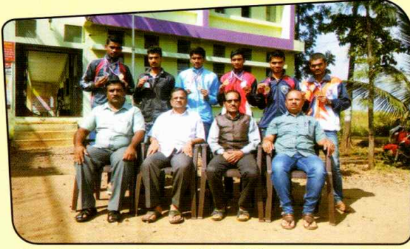
विभागीय व आंतरविभागीय रिले स्पर्धेतील सुवर्णपदक विजेते