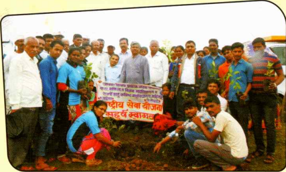
रासेयो विभागामार्फत बसगे चेथे वृक्षारोपण