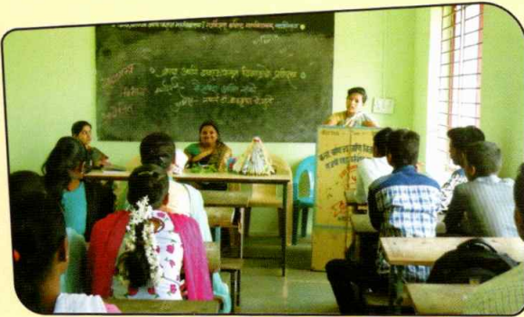
गृहशास्त्र विभाग प्रशिक्षण कार्यशाळा