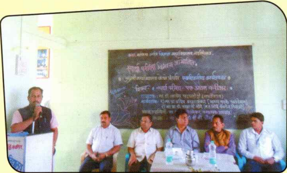
स्पर्धा परीक्षा अग्रणी कार्यशाळा उद्घाटन समारंभ