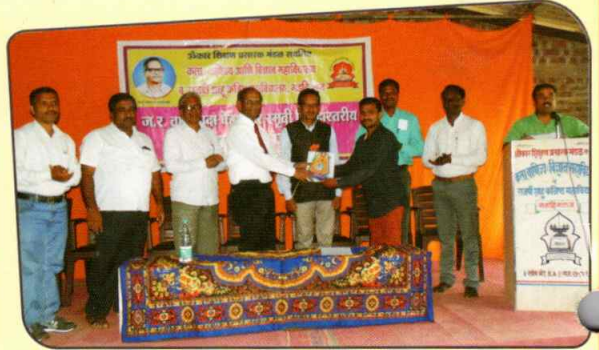
दादा पेडणेकर जिल्हास्तरीय वक्तृत्व स्पर्धा