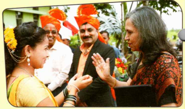
नॅक पिअर टीमचे स्वागत