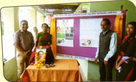
प्रेमचंद जयंती निमित्त भिक्तीपत्रक उद्घाटन करताना मा. प्राचार्य