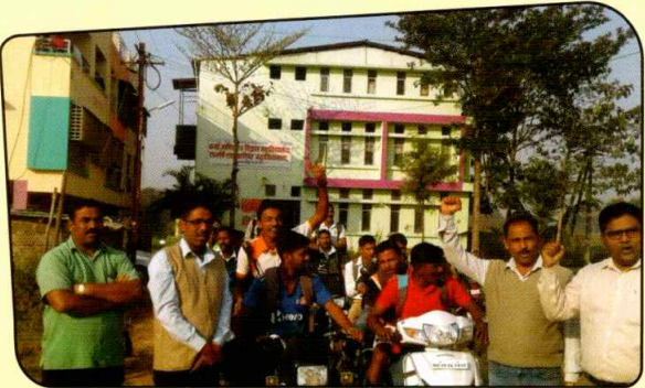
मतदार दिनानिमित्त जनजागृती रॅली काढताना