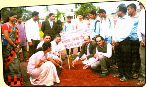
कोर्ट परीसरत वृक्षारोपण करताना मान्यवर