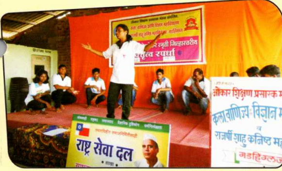
स्त्री-भ्रुण हत्या विषयक पथनाट्य सादर करताना