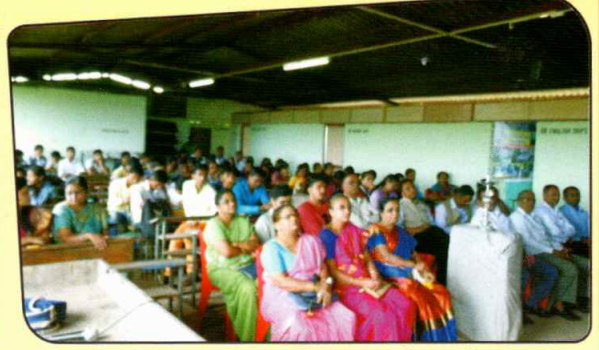
वार्षिक स्नेहसंमेलन पारितोषिक वितरण समारंभ उपस्थित मान्यवर