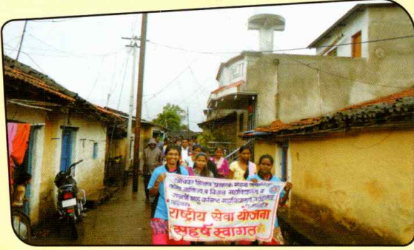
रासेयो जनजागृती रॅली