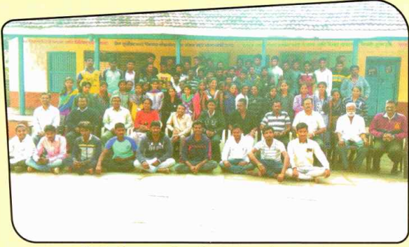
रासेयो जिल्हास्तरीय शिबीर समारोप समारंभ