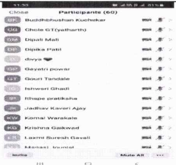
Attendance of the Workshop